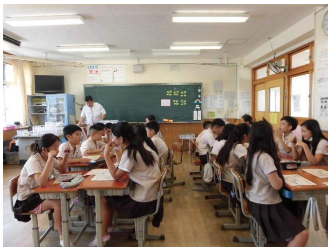
夏休みの出来事についてのインタビュー